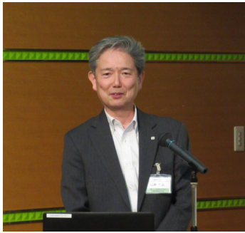
石川、富山で120年 白山支店になります