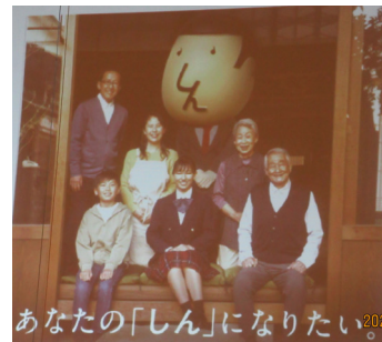
あなたの「しん」になりたい。